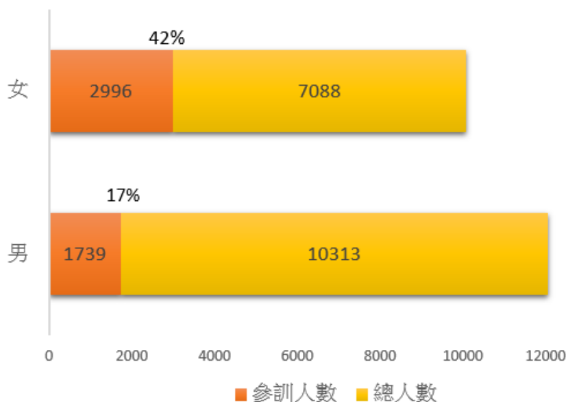
圖2. 111年臺中市政府所屬機關男女公務人員總人數、參加性別主流化教育訓練人數及參訓比率

男性公務人員之參訓率明顯偏低，推估與工作性質相關，以外勤工作為主的職位多為男性擔任，男性公務人員在辦公室以外場所工作之比例較女性高，而實體教育訓練則多於辦公室內舉辦，外勤人員多以數位方式參訓，故男性公務人員之性別主流化教育訓練實體課程參訓率低於女性參訓率。